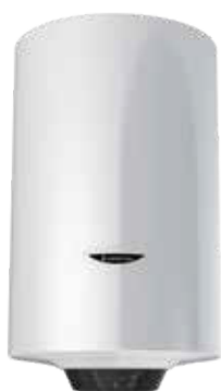
PRO1 ECO DRY MULTIS