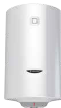
PRO1 R DRY MULTIS